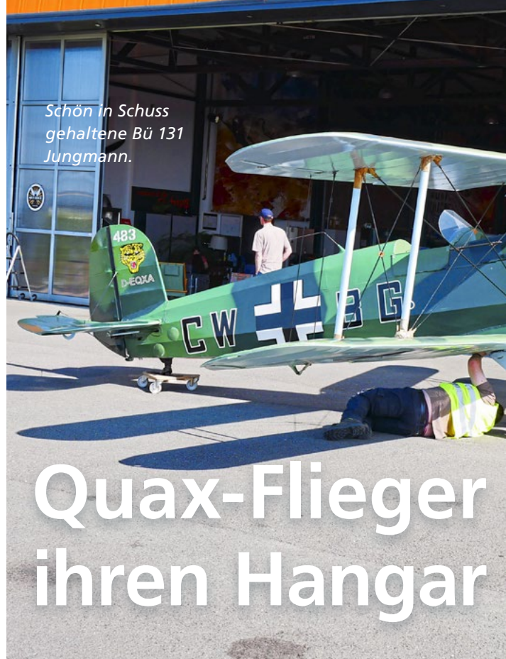
Schön in Schuss gehaltene Bü 131 Jungmann.