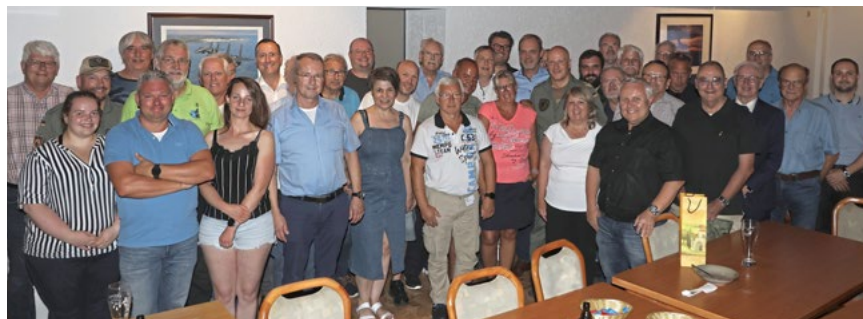
Zahlreiche Mitglieder nutzten in Nörvenich die Gelegenheit zur Diskussion mit dem Inspekteur der Luftwaffe.