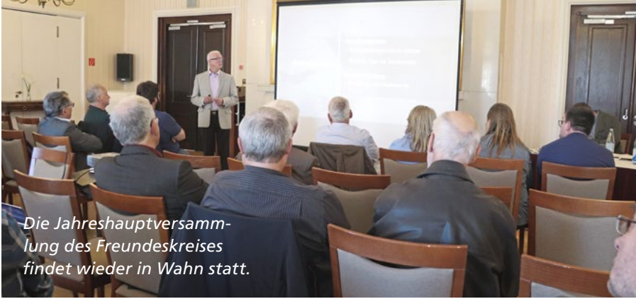
Die Jahreshauptversammlung des Freundeskreises findet wieder in Wahn statt.