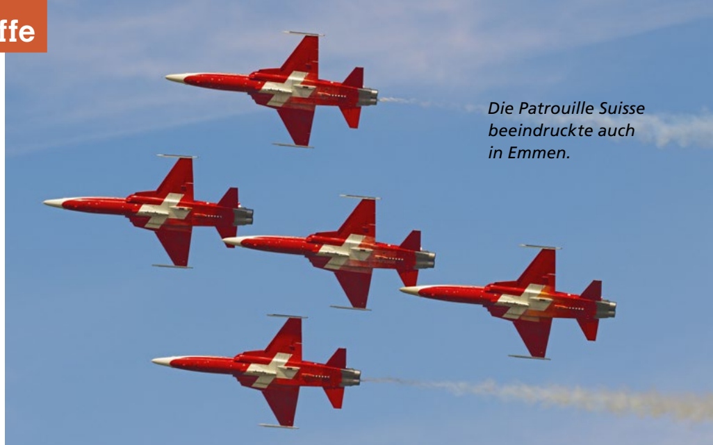
Die Patrouille Suisse beeindruckte auch in Emmen.