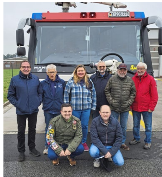
Die Sektion Wunstorf war wieder in Diepholz zu Gast, wo auch die Feuerwehr vorgestellt wurde.

Mit nicht weniger technischem Einsatz zeigten sich die Luftwaffenpioniere. Um nach Angriffen auf Flugplätze die Pisten wiederherzustellen, stehen ihnen diverse Baumaschinen und Fahrzeuge zur Verfügung. Nach vier Stunden soll mit provisorischen